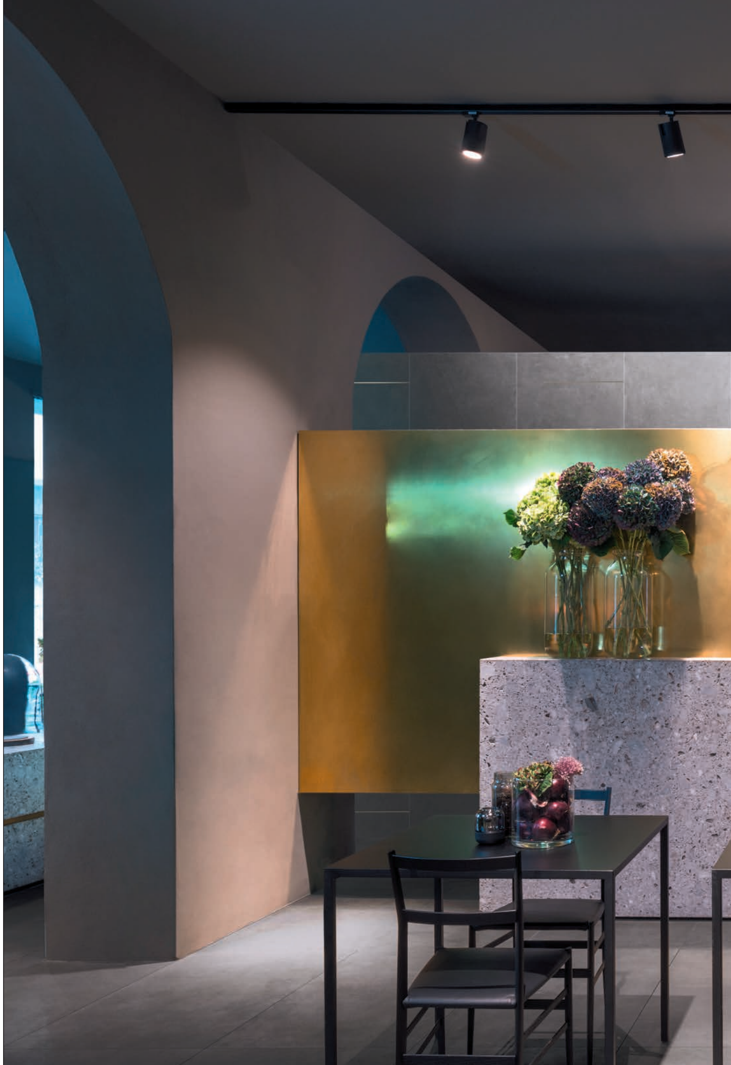
LIVING , pavimento / flooring LINES 1A (cm. 60x120 - 24"x48"), Rivestimento / covering LINES 1B (cm. 60x60 - 24"x24")