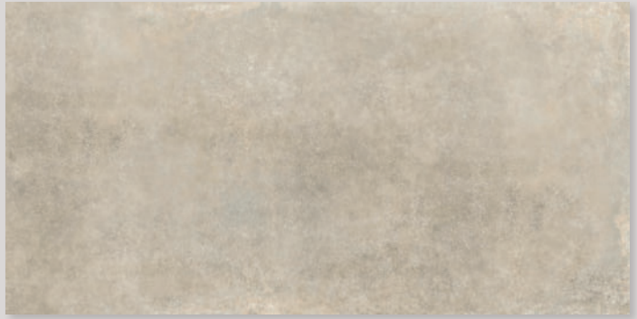
LINES2A - PEI IV / R10 / DCOF