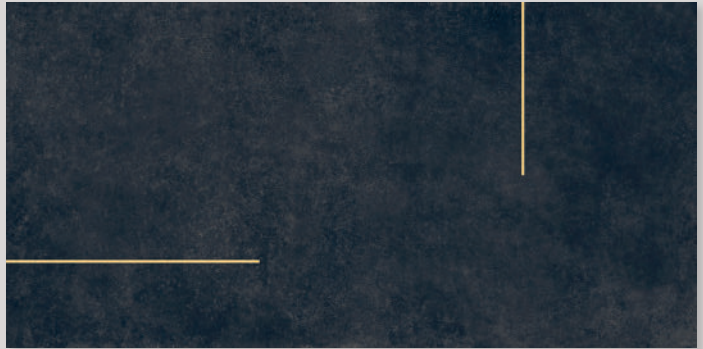
★ LINES 3B - PEI III / R10 / DCOF - (con listello ottone o acciaio - with brass or steel strip)