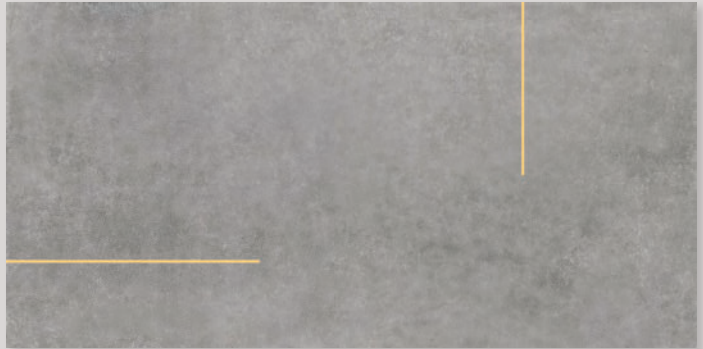
★ LINES 1B - PEI IV / R10 / DCOF - (con listello ottone o acciaio - with brass or steel strip)