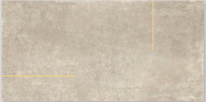
★ LINES2B - PEI IV / R10 / DCOF - (con listello ottone o acciaio - with brass or steel strip)