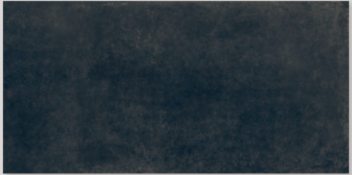
LINES 3A - PEI III / R10 / DCOF