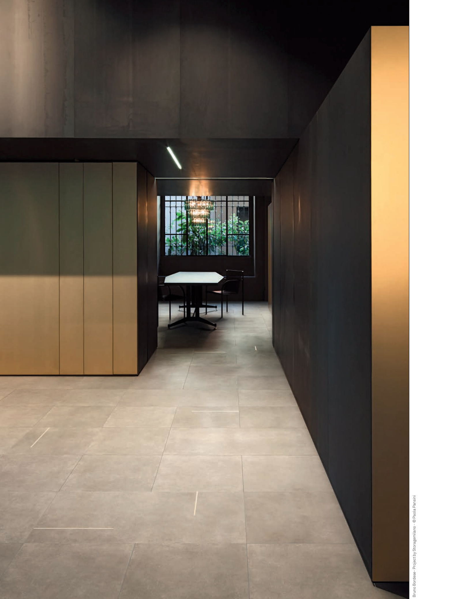
LIVING , pavimento / flooring LINES 2A-2B (cm. 60x120 - 24"x48" - cm. 60x60 - 24"x24")