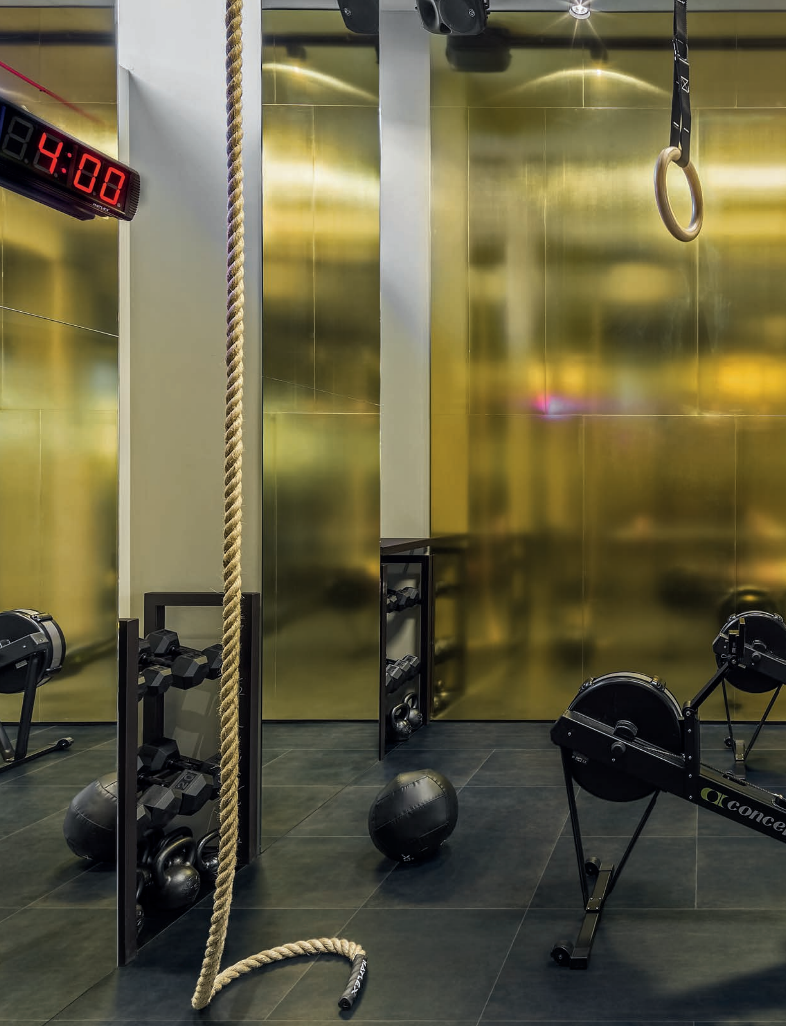
CONTRACT pavimento / flooring LINES 3A (cm. 60x60 - 24"x24" / cm. 60x120 - 24"x48")