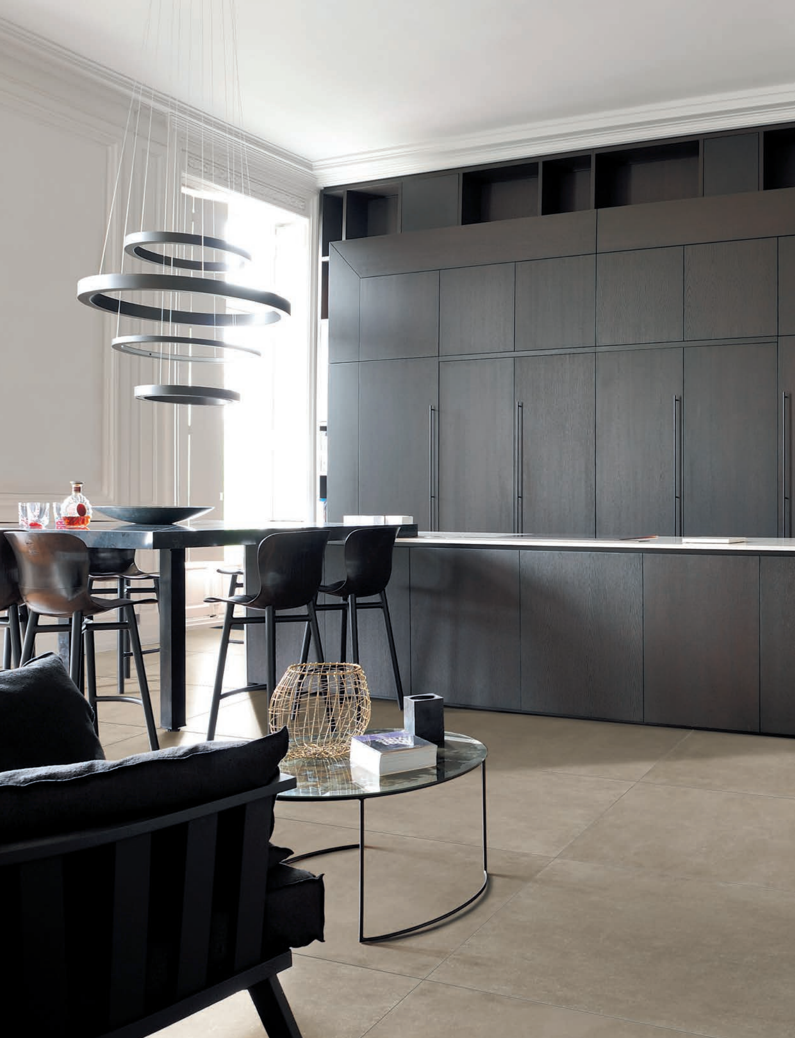
CUCINA/KITCHEN, pavimento / flooring LINES 2A-3A (cm. 60x120 - 24"x48")